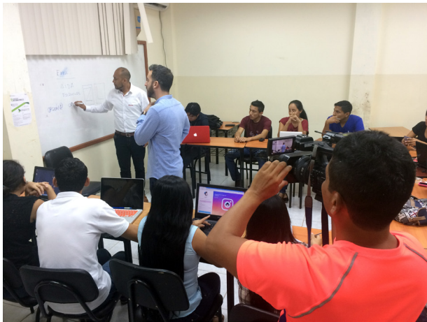
Imagen 1. Preparación del Grupo 1.

8 personas cada uno de ellos en los que se incluían, por un lado, en el Grupo 1, estudiantes de la Facultad de Ciencias de la Comunicación de la Universidad Laica Eloy Alfaro de Manabí con edades comprendidas entre 18 y 25 años, y por otro lado en el Grupo 2, a personal administrativo y docentes con un rango de edades de 30 a 45 años.