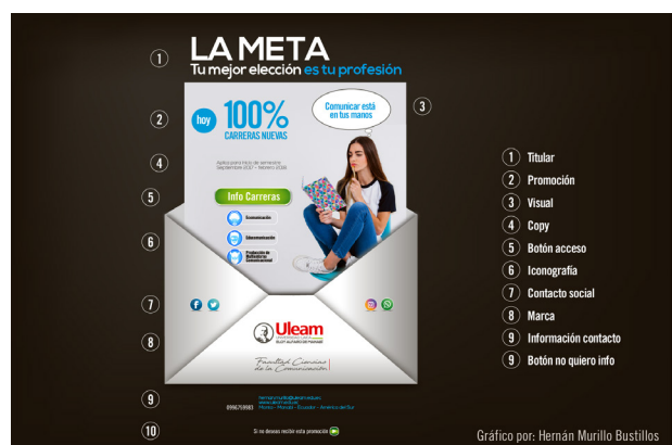
Imagen 2. Email tradicional. Fuente: Simulación Email del autor Elaborado: Por los autores