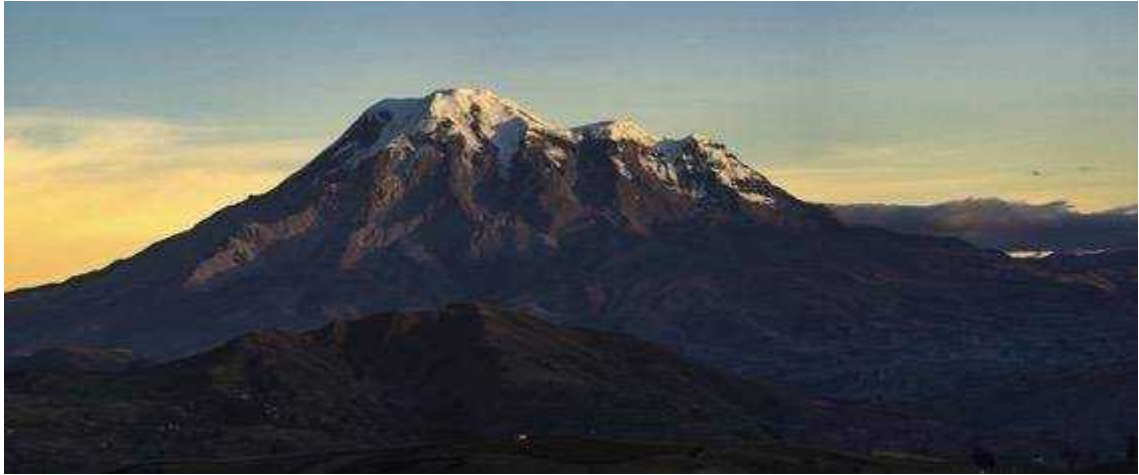
Figura 5 – 1: Vista al volcán Chimborazo al amanecer.

Colta, Riobamba, Pallatanga, Penipe, Colta, Cumandá, Chambo y Guamote, siendo Riobamba su capital. La creación de la provincia data el 25 de junio de 1824.