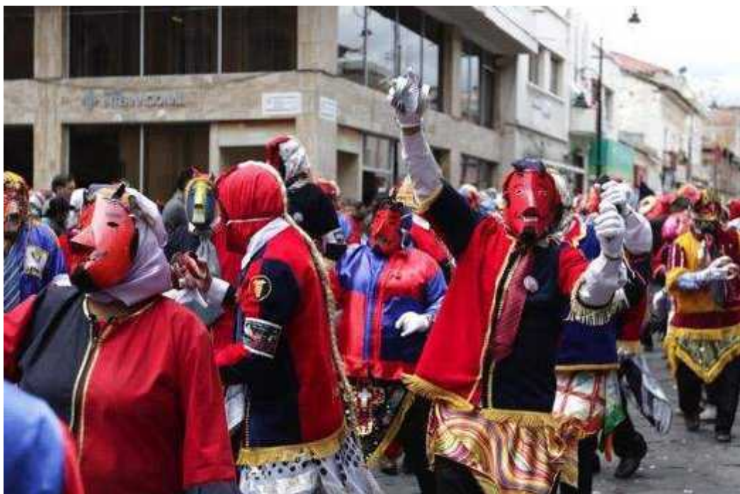
Figura 3 – 1: Diablos de lata siendo partícipes del Pase del Niño en las calles de Riobamba.

La guía de bienes culturales de Ecuador (2010) “Las celebraciones populares no han perdido vigencia prácticamente en ninguno de los cantones y parroquias: la religiosidad, predominantemente católica, se manifiesta sobre todo en las procesiones de Semana Santa; en diciembre y enero se aprecian coloridas fiestas de Pase del Niño, que visten las mismas calles que en otro momento acogen el recorrido de cortejos fúnebres acompañados de bandas de pueblo al son de tonos elegiacos”