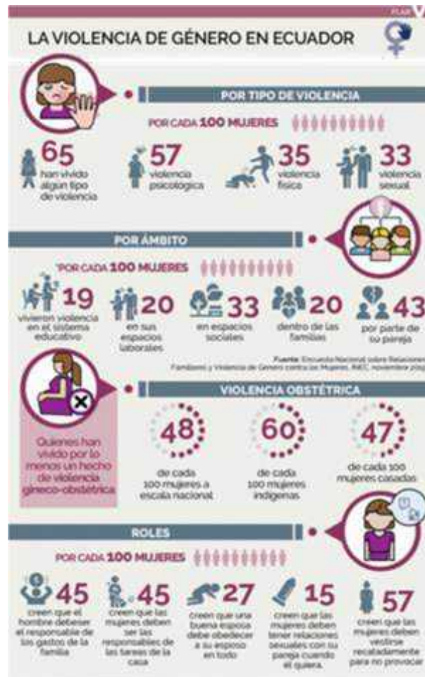
Figura 2 – 1: La violencia de género según encuesta del INEC, noviembre 2019.