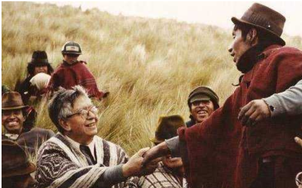
Figura 7 – 1: Monseñor Leonidas Proaño saludado a un grupo de indígenas.

Otro referente dentro de la provincia es el Monseñor Leonidas Proaño, el cual se lo conoce como el precursor, creador y padre de las organizaciones étnicas de Chimborazo y demás pueblos, pues entre sus acciones más reconocidas están las fundaciones de MICH, ECUARUNARI e incluso fue uno de los que ayudó a que la CONAIE se pusiera de pie en sus inicios.