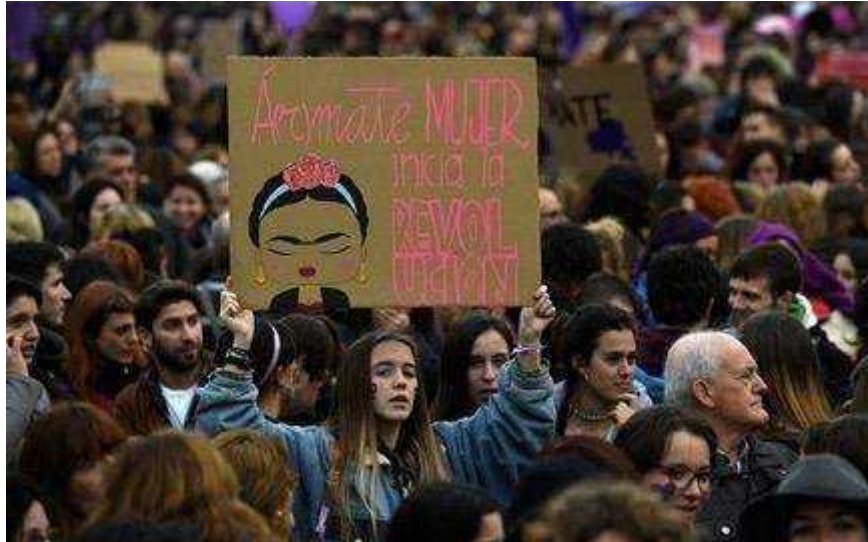
Figura 4 – 1: Una manifestante alzando un letrero con un dibujo de Frida Khalo en una marcha.

feminismo a nivel internacional, pues dentro de su labor cotidiana que era la pintura, supo inculcar su cultura, para promover la raíz indígena de su país, siendo una fuente de inspiración para mujeres que buscaban este mismo objetivo y en general a grandes artistas del medio.