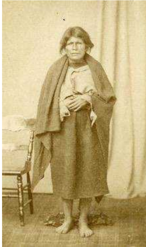
Figura 8 – 1: Retrato de Manuela León, líder indígena en 1872.