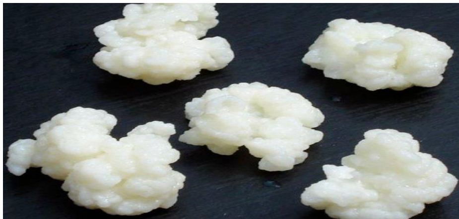
Figura 1-1: Nódulos de kéfir.

Estos gránulos de kéfir se caracterizan por su superficie irregular, y multilobular, se unen por una única sección central y su color varía de blanco a blanco amarillento, son elásticos y tienen una textura viscosa y firme, (Iniesta, 2016 pág. 17).