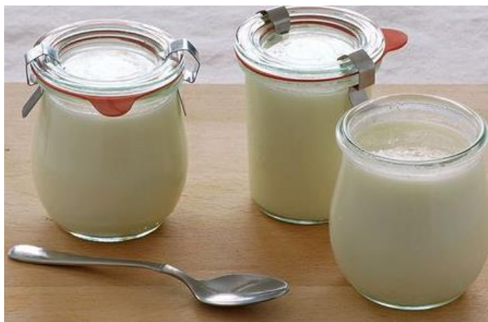
Figura 3-1: Leches fermentadas