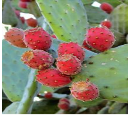
Figura 2-1: Tuna ( Opuntia ficus-indica )